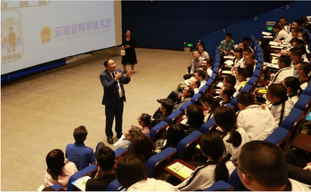
康乐院士在解答学生提问