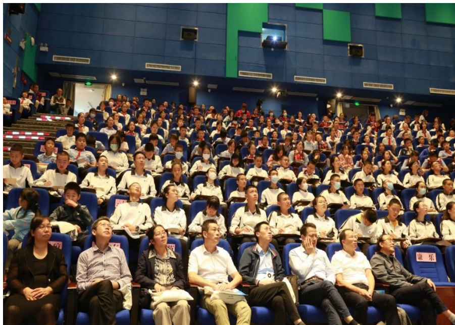
昆明动物博物馆报告厅座无虚席