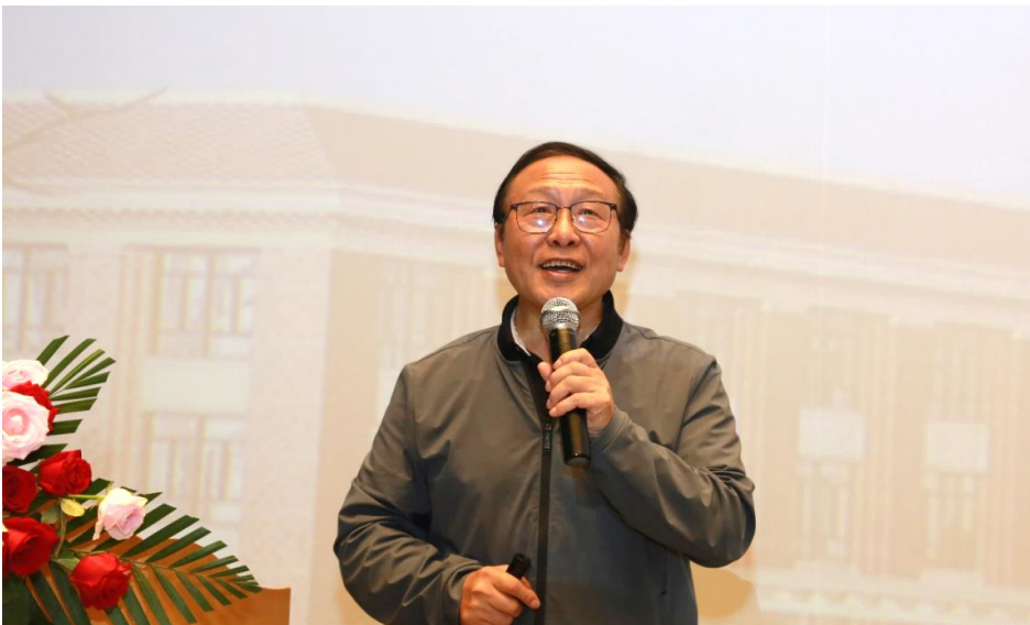
张克勤院士：真菌与线虫的战争