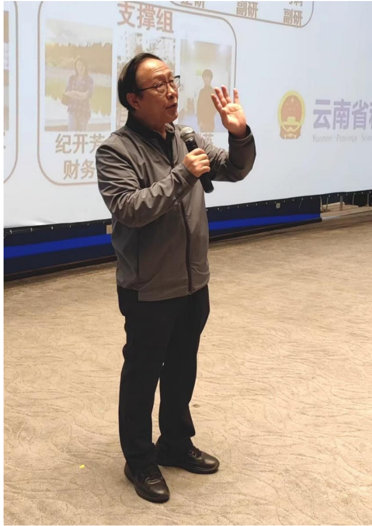
张克勤院士在现场回答同学们的提问